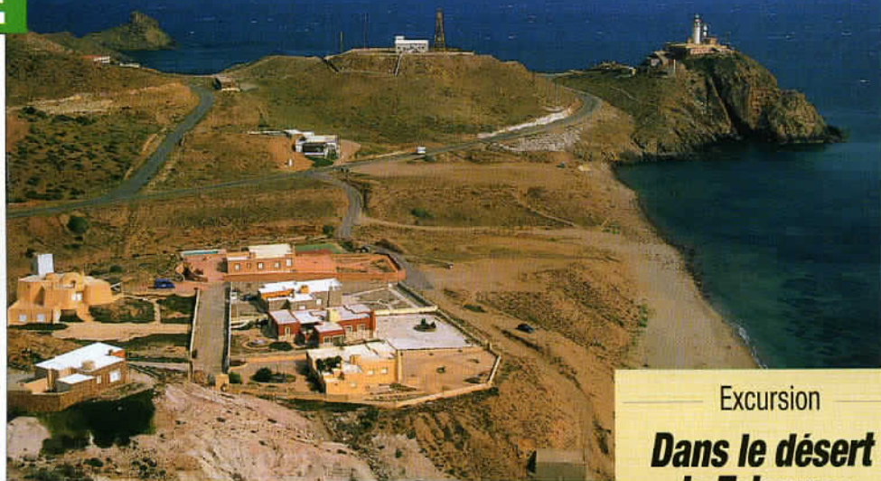
Au Cabo de Gata, les paysages dépouillés et grandioses rappellent que l'Orient n'est pas loin. En Andalousie, chaque village, ou presque, a son propre jambon !